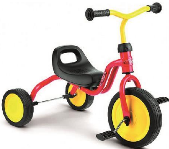
Produit C : Tricycle 18 mois et plus - Puky