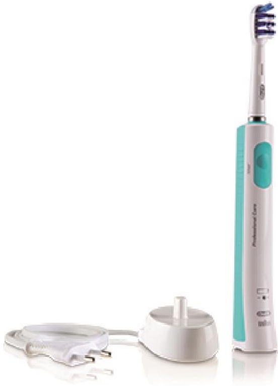
Produit A : Brosse à dents électrique - Oral-B Trizone