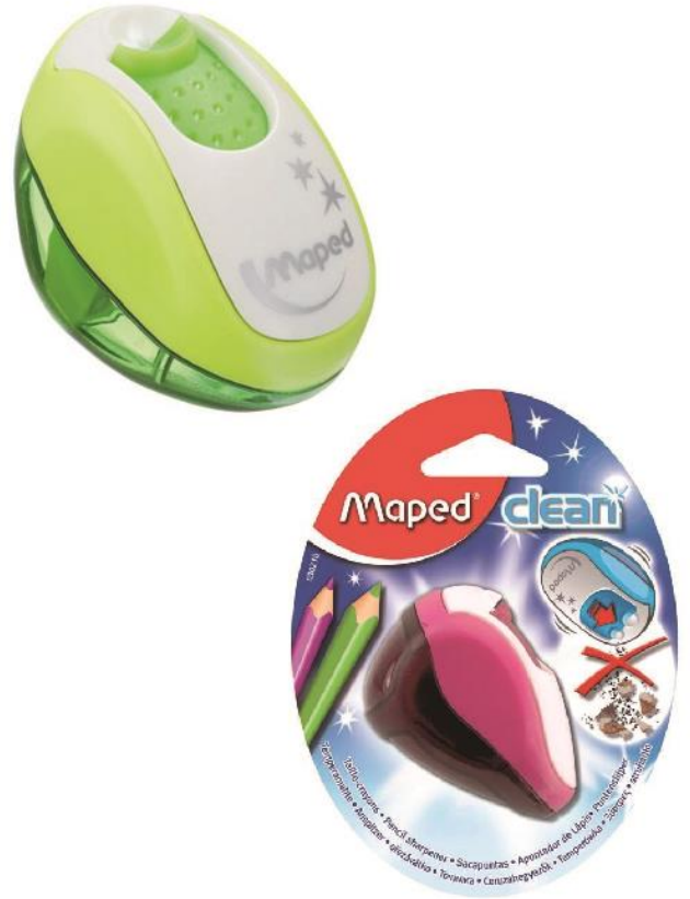
Produit B : Taille crayon - Maped